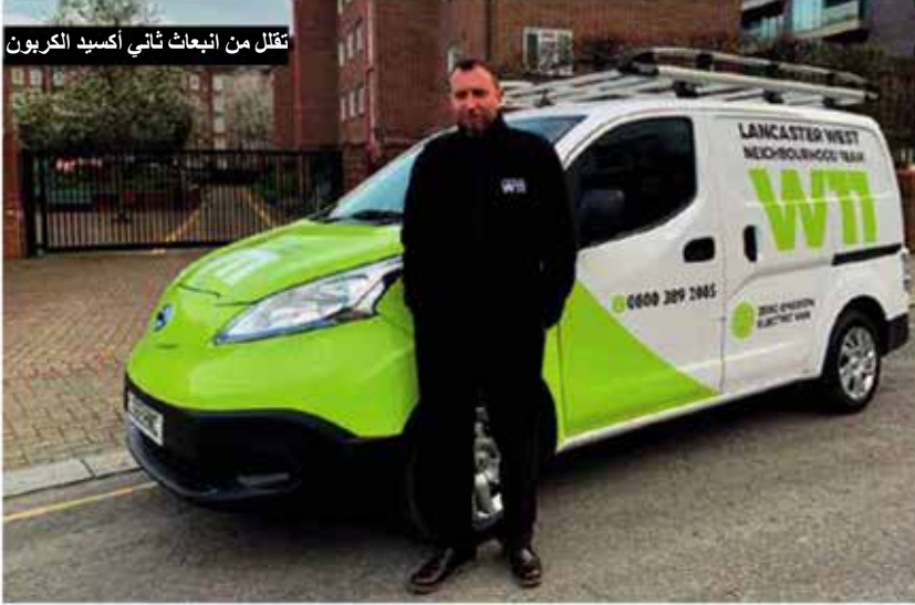
تقلل من انبعاث ثاني أكسيد الكربون