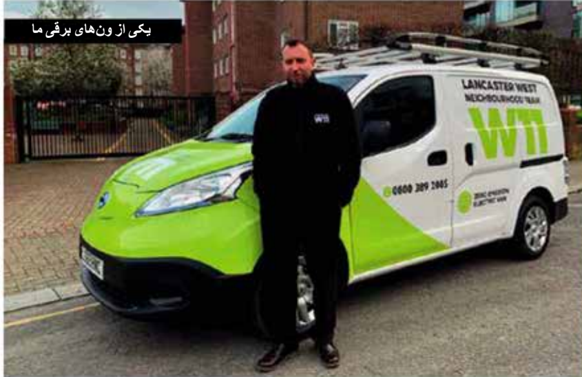
یکی از ون‌های برقی ما