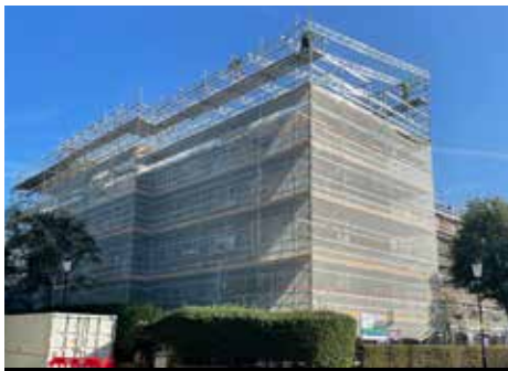
کار بازسازی با حداقل کرین در Treadgold House در حال انجام است.

بیش از 50 درصد از تمام خانه‌های استیجاری در Lancaster West بازسازی داخلی شده‌اند - اکثر آنها با آشپزخانه‌های جدید، حمام، و سیستم‌های گرمایش و آب گرم مجهز شده‌اند.